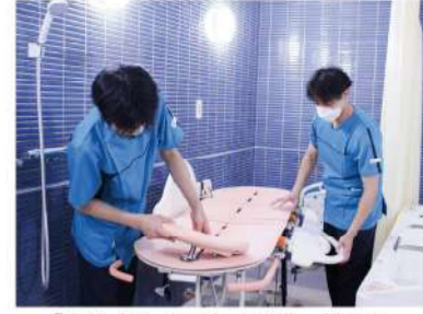
「入浴介助（写真は準備の様子）」