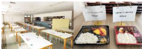
食堂（新病院以外） お弁当（新病院のみ）