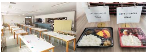
食堂（新病院以外） お弁当（新病院のみ）