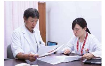
医師とのやりとりも多いです！

環境が変化しても、「自分のライフスタイルに合わせて仕事をする」ことが可能です♪実際にそのような先輩がいるので安心です！