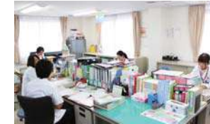
医療福祉相談室の風景