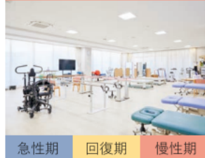
急性期 回復期 慢性期