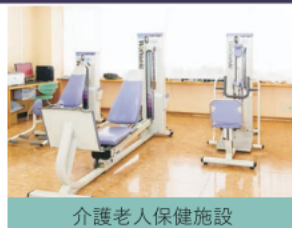
介護老人保健施設