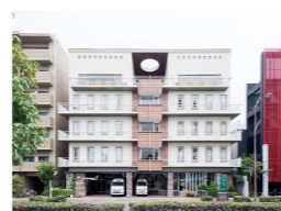
介護老人保健施設 錦秀苑