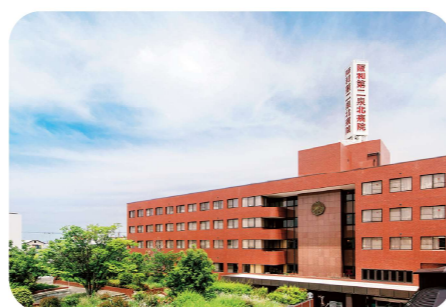
阪和第二泉北病院

病床数1,024床を有し、多くの高齢者の方が入院している慢性期の医療療養型病院です。