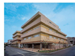
阪和第二住吉病院

その他にも… 慢性期の医療療養型病院である「阪和第二住吉病院」在宅復帰を支援する「介護老人保健施設 錦秀苑」介護・看護・ケアプランの3事業所が一体となって在宅生活を支援する「阪和訪問看護ステーション/阪和訪問ヘルパーステーション/阪和ケアランセンター」など様々な事業所があり、地域医療に貢献しております。