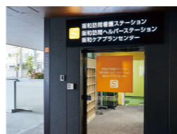
阪和訪問看護ステーション 阪和訪問ヘルパーステーション 阪和ケアプランセンター